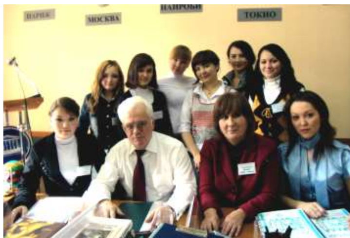
Члены Клуба ЮНЕСКО «Аврора»

Кроме того, лицеисты прошли стажировку в г. Екатеринбурге и участвовали в турнире по ораторскому искусству среди международных молодежных лидеров (ММЛ), а также в чемпионате городов России по ораторскому мастерству среди ММЛ в г. Алапаевске, где заняли 1-е место.