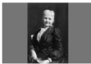
Мэри Харрис Джонс (Мамаша Джонс)

— С каким профсоюзным лидером мечтал познакомиться и в итоге встретился Чарли Чаплин?