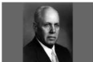
Уильям Джордж Мэнни

— Самый противоречивый профсоюзный герой, чье тело до сих пор не найдено.