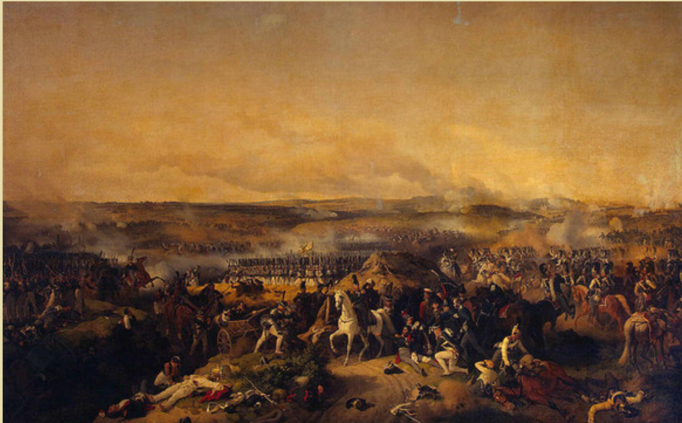
Бородинское сражение. Художник Петер фон Гесс. 1843 год

Еще позднее в галерею поместили две работы художника Петера фон Гесса, современника Джорджа Доу, - «Бородинское сражение» и «Отступление французов через реку Березину»