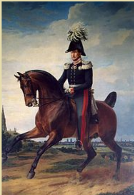
Портрет Фридриха-Вильгельма III