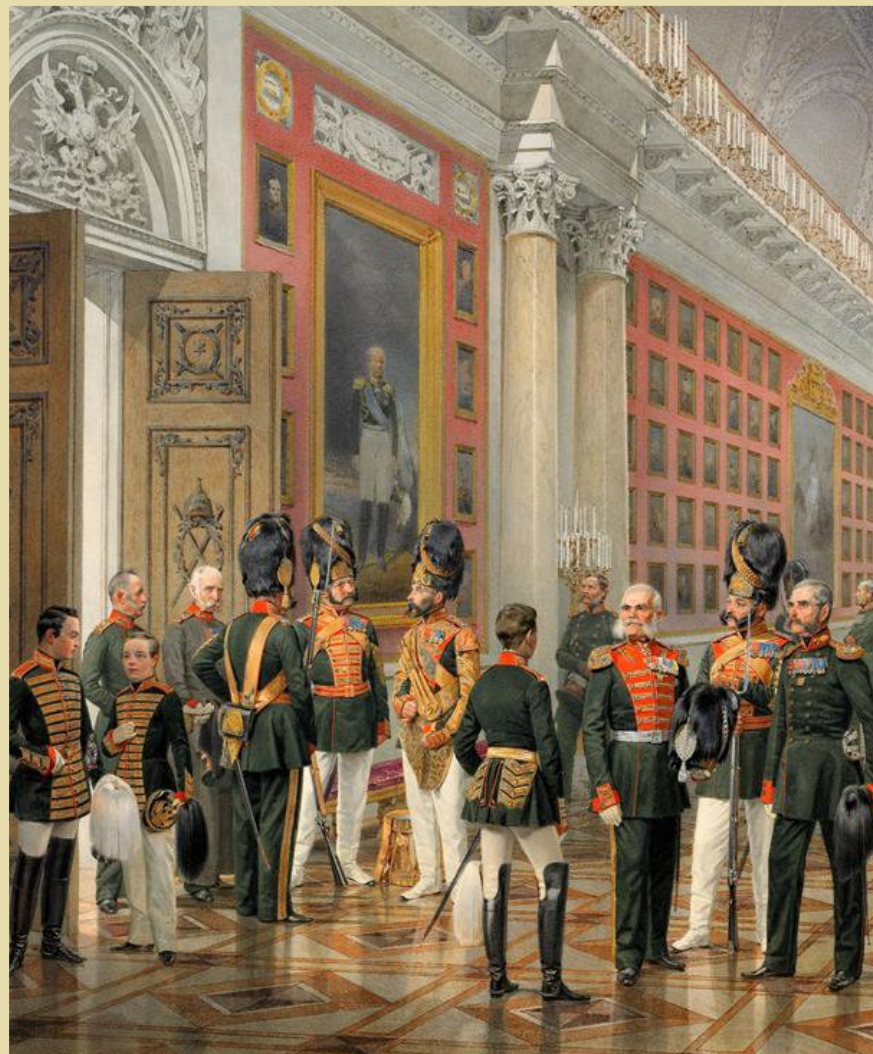
Рота Дворцовых Гренадер. Художник К. К. Пиратский

Торжественная церемония открытия зала состоялась 25 декабря 1826 года в годовщину изгнания армии Наполеона из России. К открытию галереи многие портреты ещё не были написаны и на стенах были размещены рамы, затянутые зелёным рещом, с именными табличками. По мере написания картины размещались на своих местах. Большинство портретов писалось с натуры, а для уже погибших или умерших персонажей использовались портреты.