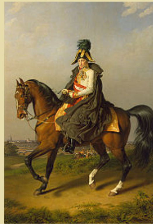
Портрет Франца I Художник П.Крафт

В 1830-х годах в галерее были помещены большие конные портреты Александра I и его союзников короля прусского Фридриха-Вильгельма III и императора австрийского Франца I. Два первых написаны берлинским придворным художником Ф. Крюгером, третий - венским живописцем П. Крафтом