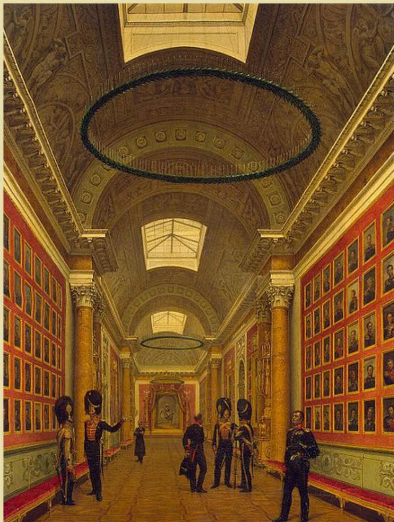
Военная галерея Зимнего дворца. Г. Чернецов. 1827 год.

Картина Г.Г. Чернецова запечатлела вид галереи в 1827 году. Потолок с тремя световыми фонарями, по стенам расположены пять горизонтальных рядов нагрудных портретов в золоченых рамах, разделенных колоннами, портретами в рост и дверями в соседние помещения. По сторонам этих дверей вверху находились двенадцать лепных лавровых венков, окружающих названия мест, где происходили наиболее значительные сражения 1812-1814 годов, начиная с Клястиц, Бородина и Тарутина до Бриена, Лаона и Парижа.