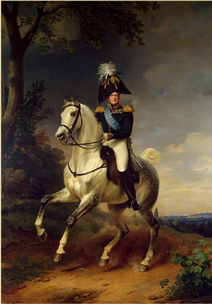
Портрет Александра I. Художник Ф.Крюгера, в торце галереи.

Император Александр I лично утверждал составленные Главным штабом списки генералов, чьи портреты должны были украсить Военную галерею. Это были участники Отечественной войны 1812 года и заграничных походов 1813-1814 гг., которые состояли в генеральском чине или были произведены в генералы вскоре после