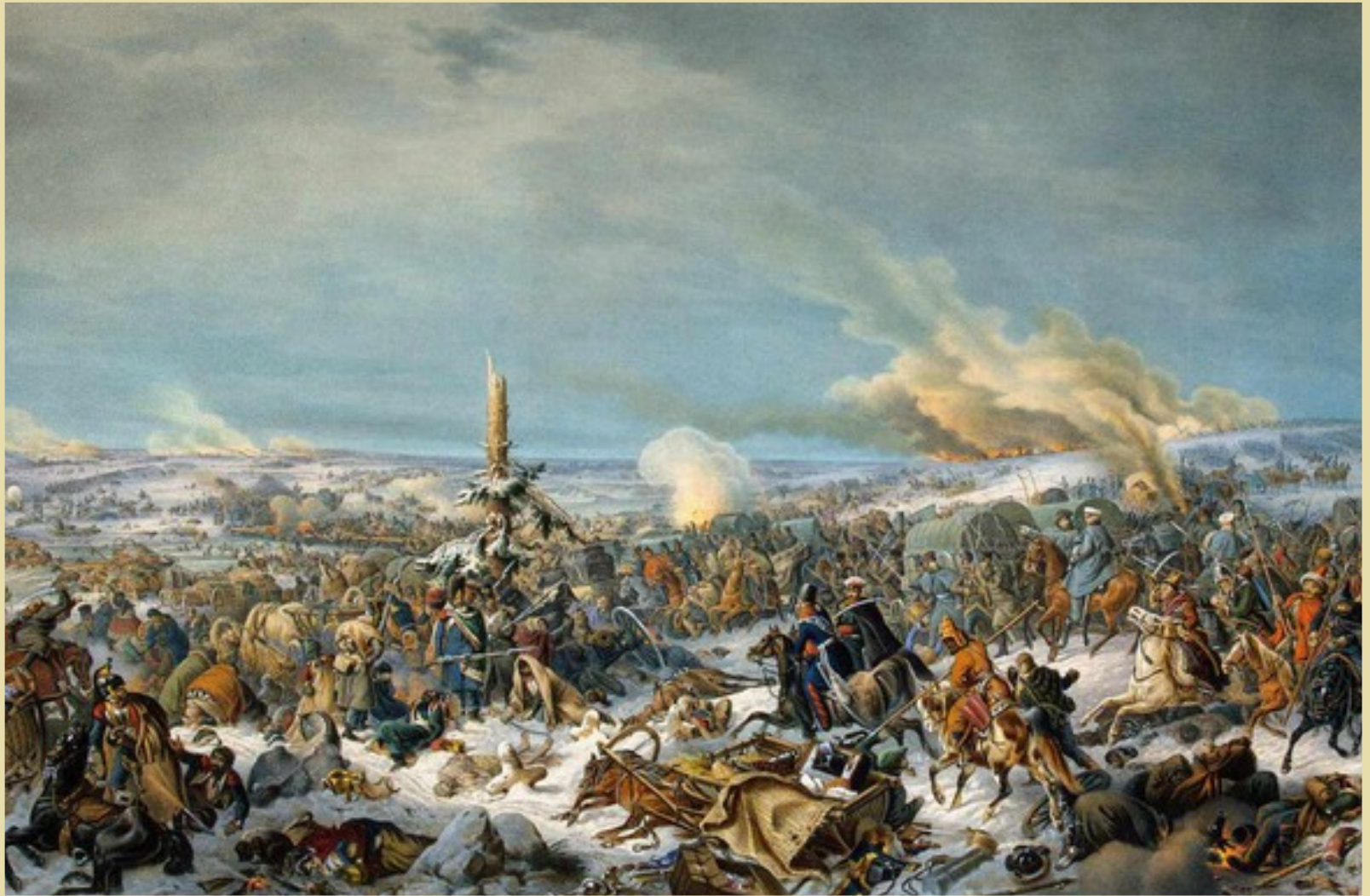
Отступление французов через реку Березину. Художник Петер фон Гесс. 1844 год.